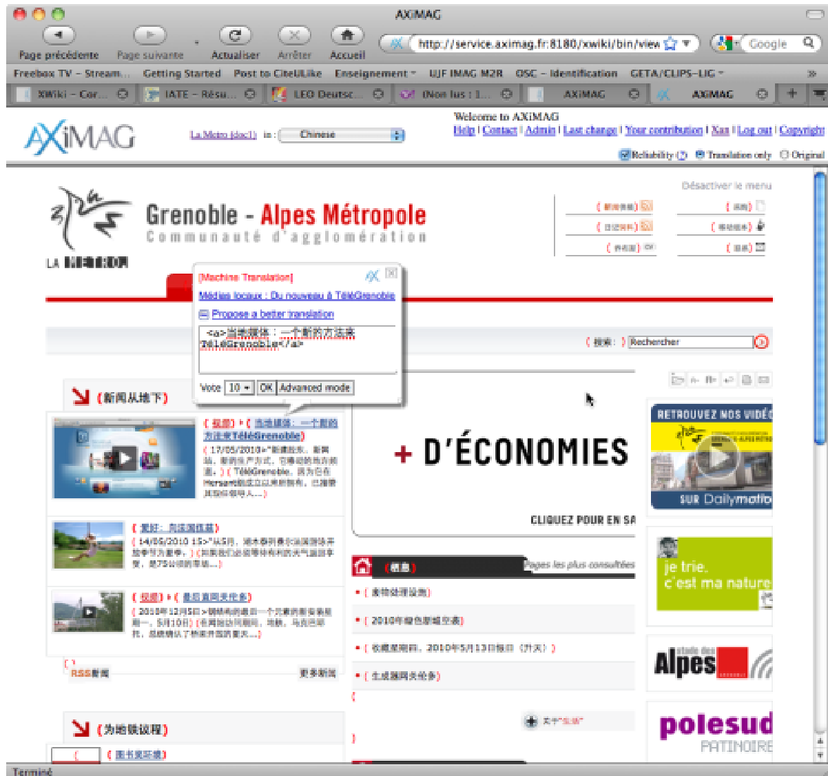
Figure 7: demonstration on the La Métro (Greater Grenoble) web site